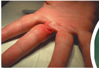
Abbildung 2 a und 2 b: Schnittwunde über einem Bewegungssegment – konventionelle Naht notwendig.