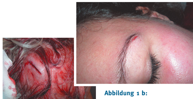
Abbildung 1 a: Kopfplatzwunde bei einer älteren Frau – gut für den Gewebekleber geeignet.

1) Behandlung von vital gefährdenden Begleitverletzungen. Insbesondere sollte bei Gefäßverletzung zunächst eine Blutstillung im Vordergrund stehen. Auch bei arteriellen Blutungen ist das Komprimieren des blutenden Gefäßes meist mit Druck auf die Wunde in